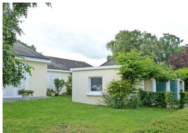
Annexe indépendante en premier plan, préservant un espace d'intimité devant la maison.