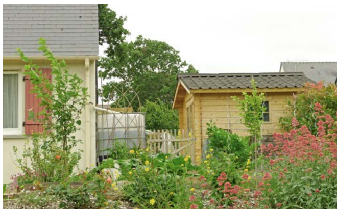
Cuve de récupération d'eaux pluviales en cours de végétalisation et abri de jardin.