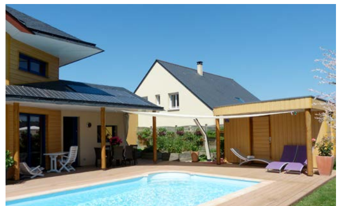
Local technique et abri en cohérence avec la maison et sa terrasse. Ancenis, jardin privé.