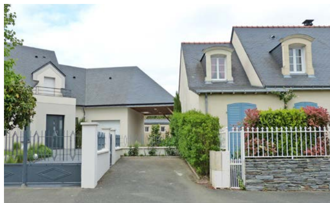
Un garage préau en continuité de l'existant. Angers, quartier Villesicard.