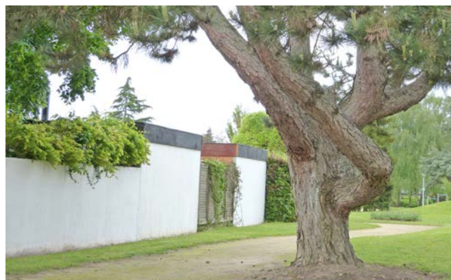
Des annexes en limite de propriété, prolongeant la clôture. Un treillage avec des plantations complémentaires permettrait de parachever l'ensemble. Angers, quartier Village Anjou.