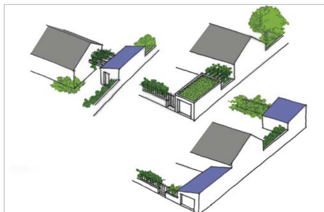
Exemples de croquis d'étude et d'implantation pour des projets d'annexes, en fonction de la position de la maison sur la parcelle.